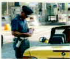
Controllo della patente

stampa | dizionario | invia per E-mail | condividi